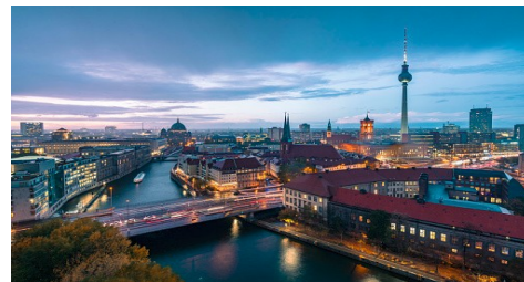
Anders lernen mit einer innovativen soziokulturellen und künstlerischen Ausbildung: Außerschulische Bildung!